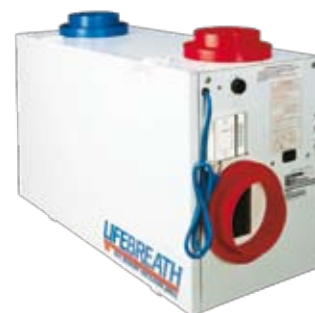
HRV - Rekuperační jednotky